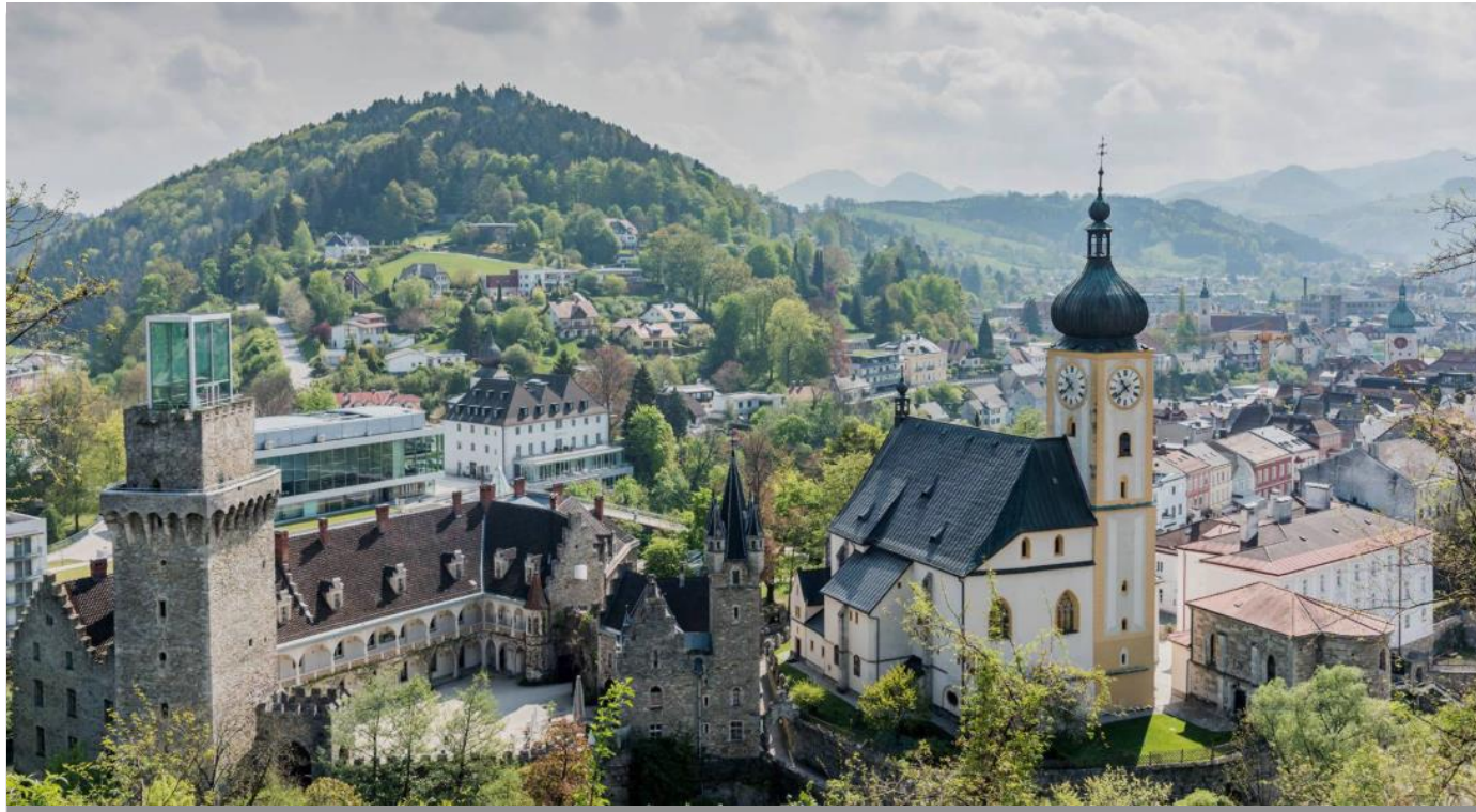
Waidhofen a.d. Ybbs (Herbst 2008)